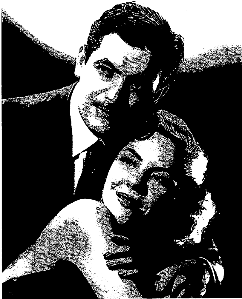
Amelia Bence y Alberto Closas - 1950